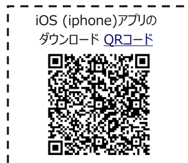
iOS (iphone)アプリのダウンロード QRコード

ダウンロードマークをタップすることで、コース内の一部 / 全動画の一括ダウンロードが可能です。