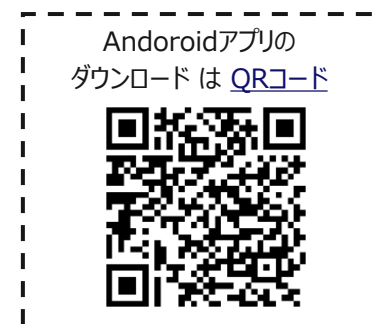
Androidアプリのダウンロードは QRコード